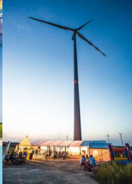
Idylle am Fuß der höchsten Windräder Österreichs in Hohenruppersdorf.

Die IG Windkraft bedankt sich bei allen Veranstaltern für ihr Engagement: atomstopp_oberoesterreich ● Bucklige Welt Wind ● Energie Burgenland ● Energiepark Bruck ● evn-naturkraft ● EWS Consulting ● ImWind ● Kelag ● Ökoenergie Wolkersdorf ● oekostrom ● ÖkoWind ● Sternwind ● Ventureal ● Verein WAVE ● Viktor-Kaplan-Akademie ● W.E.B ● Wien Energie ● Windkraft Simonsfeld