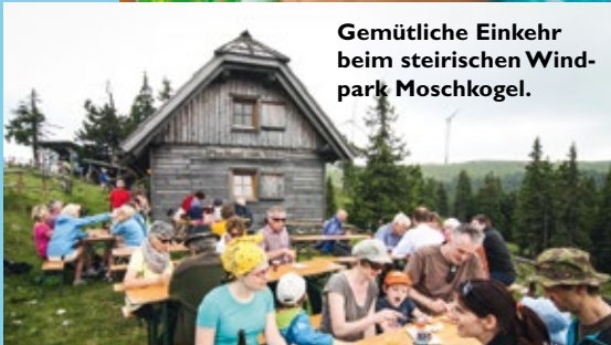
Gemütliche Einkehr beim steirischen Windpark Moschkogel.