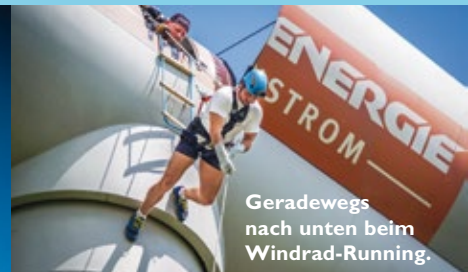
Geradewegs nach unten beim Windrad-Running.