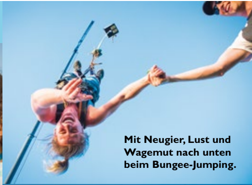
Mit Neugier, Lust und Wagemut nach unten beim Bungee-Jumping.