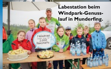
Labestation beim Windpark-Genusslauf in Munderfing.