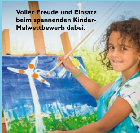
Voller Freude und Einsatz beim spannenden Kinder-Malwettbewerb dabei.