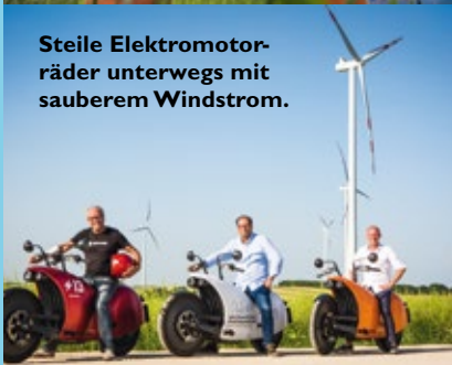
Steile Elektromotorräder unterwegs mit sauberem Windstrom.