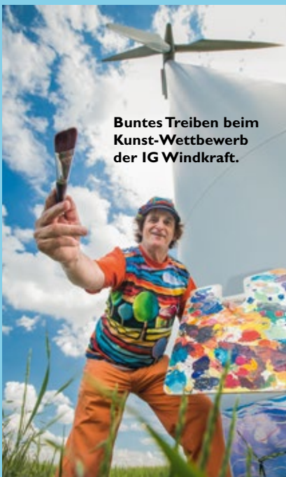
Buntes Treiben beim Kunst-Wettbewerb der IG Windkraft.

Tausende Menschen besuchten am heurigen „Tag des Windes“ eines der zahlreichen Windfeste. Viele davon fanden im Rahmen von Eröffnungen neuer Windparks statt. Für jeden Gusto gab's ein passendes Schmankerl: Bungee-Jumping, Windrad-Running, Elektrofahrzeuge, Infos beim Tag der offenen Tür, Einkehr im alpinen Windpark, Windrad-Besteigungen, Gewinnspiele, Tamburiza-Band, Malwettbewerb für Kinder, Kunstwettbewerb für Erwachsene u.v.m.